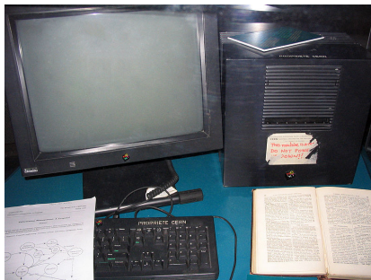
Le NeXT de Tim Berners Lee